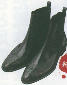
GONZAGO | ゴンザゴ

スマートなポイントドトゥとメダリオンが美しいサイドゴアブーツ。ブラッシュド加工のカーフは強い撥水性が特徴。