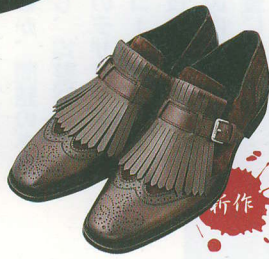
SUENO | スエノ

1920年代のアーカイブ品をモチーフにしたスエードとプレーンカーフのコンビモデル。キルトタタンは取り外しが可能。