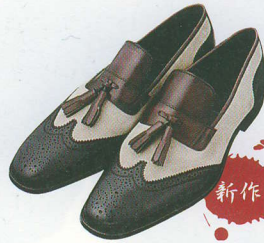
SULANO | スラノ

スエードとプレーンカーフ、そして3色レザーのコンビネーションが特徴的。遊び心に富んだタッセルローファーモデル。